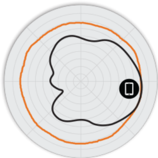
РИСУНОК 2 Азимутальная плоскость 2,4 ГГц H320 Диаграммы направленности антенны