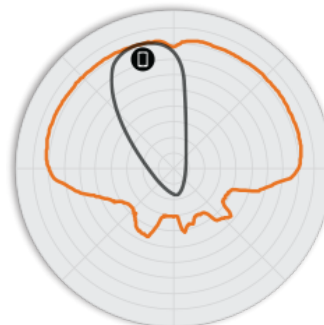
РИСУНОК 4 Вертикальная плоскость 2,4 ГГц H320 Диаграммы направленности антенны