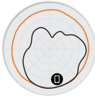
РИСУНОК 3 Азимутальная плоскость 5 ГГц H320 Диаграммы направленности антенны